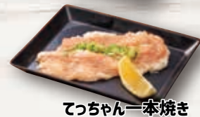
てっちゃん一本焼き