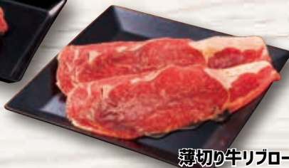
薄切り牛リブロース