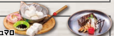
チョコブラウニーの生クリーム添え