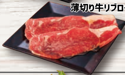
薄切り牛リブロース