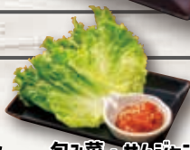
包み菜・サムジャンセット