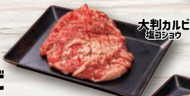
大判カルビ 塩コショウ