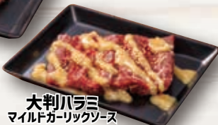
大判ハラミ マイルドガーリックソース