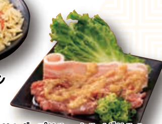
サムギョプサル・カルメギサルの 盛合せ(包み菜付き) マイルドガーリックソース