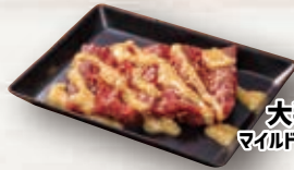
大判ハラミ マイルドガーリックソース