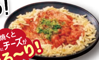
グローブチキン チーズタッカルビ