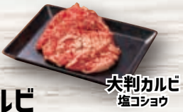
大判カルビ 塩コショウ