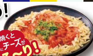
グローブチキン チーズタッカルビ