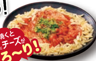
グローブチキン チーズスタッカルビ