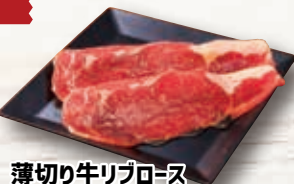
薄切り牛リブロース