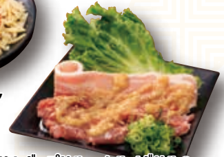
サムギョプサル・カルメギサルの 盛合せ(包み菜付き) マイルドガーリックソース